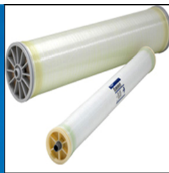
スパイラル(NF/RO)モジュール 東レ