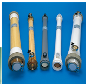
中空系(MF/UF)モジュール 旭化成